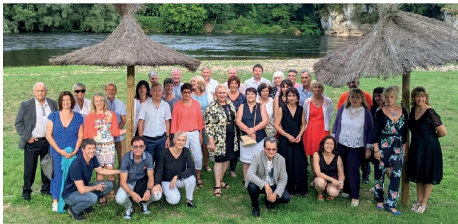
Les danseurs du Club de Danse de Cosnac pour l'EHPAD de COSNAC

Que vous soyez déjà danseur, ou que vous n'ayez jamais fait un pas de danse vous serez accueilli en toute simplicité et orienté dans le cours qui vous correspond.