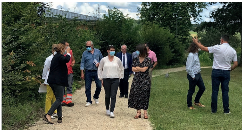
Visite du jury