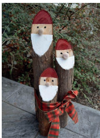
Décoration de Noël