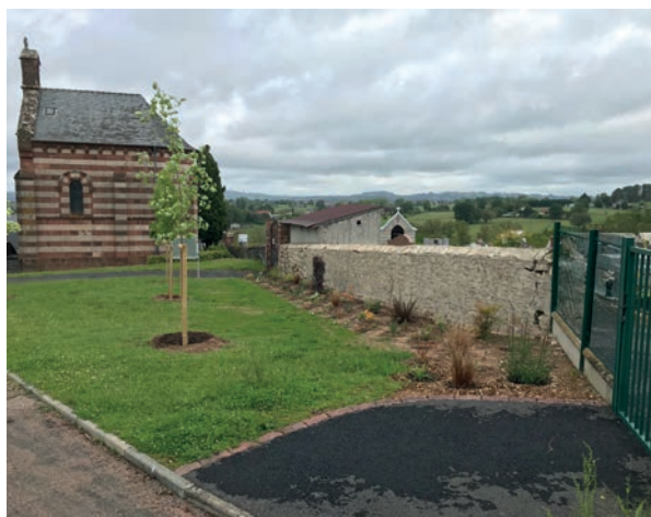
Suppression des haies

La procédure d'état d'abandon des concessions devrait être finalisée d'ici la fin d'année.