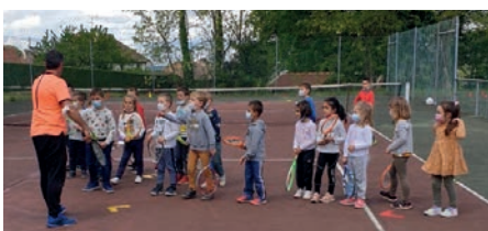
Opération Tennis à l'école

Nouveau logo, Nouveau Polo : Le tennis club de Cosnac a décidé d'offrir à tous ses licenciés un polo avec son nouveau logo. En cette période difficile, marquée par les inquiétudes autour de la pandémie, nous espérons que ce petit geste fera plaisir aux tennismen et tennismen du club. C'est pour nous une manière de les remercier de leur fidélité au club.