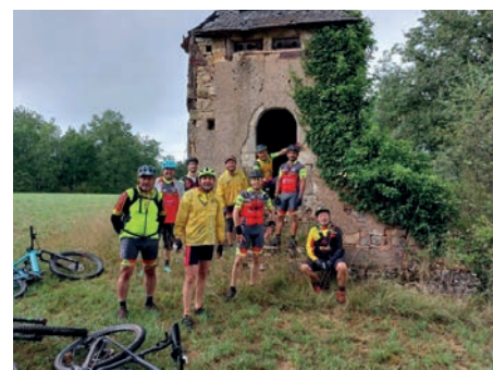
Sortie adultes du dimanche matin

L'AC COSNAC était l'un des deux clubs les plus représentés de la Nouvelle Aquitaine avec 5 participants.