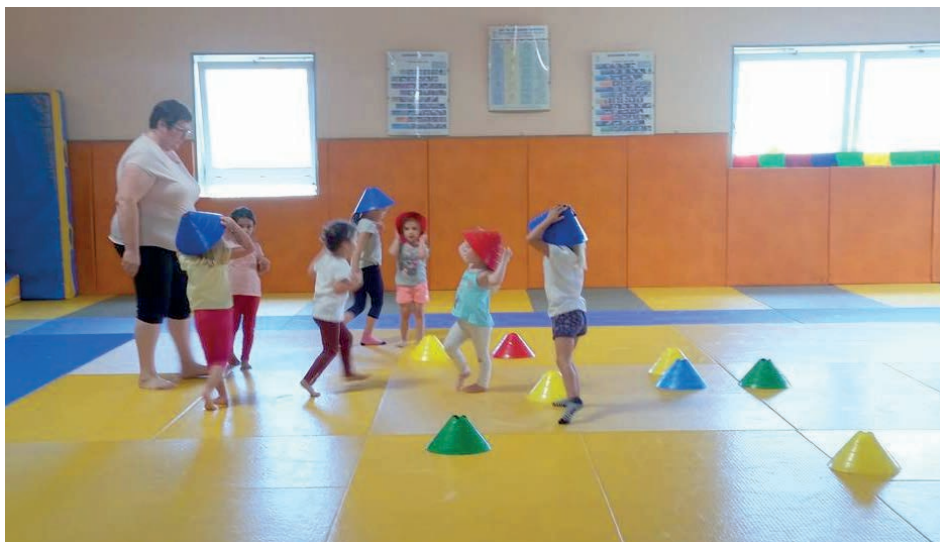
Séance de Gym des petits