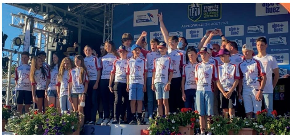
Podium Nouvelle Aquitaine