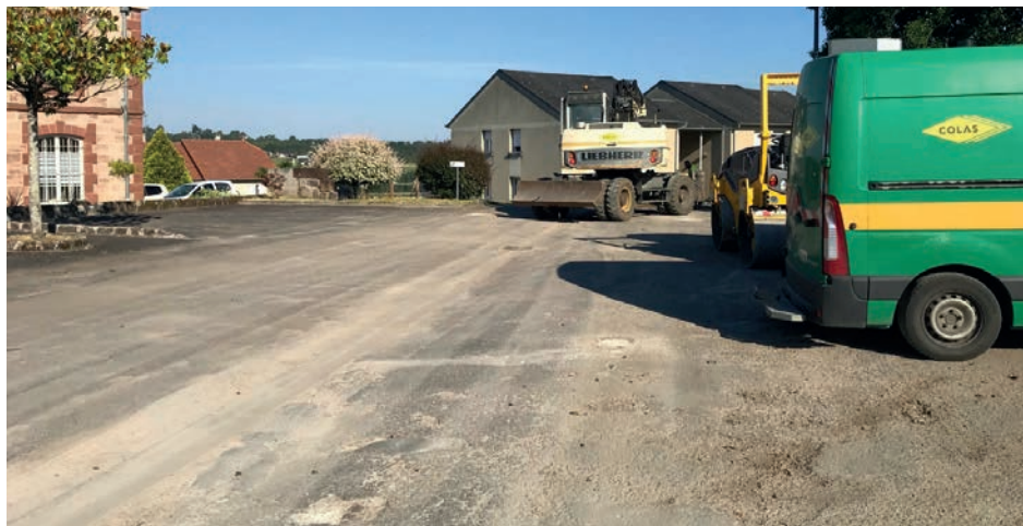
Parking de la mairie

rasol communal ont pu être préservées grâce aux bordures ciment. Cet ouvrage permettra en outre d'améliorer la sécurité en réduisant la vitesse des véhicules s'engageant sur la route de Bessac.