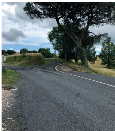
Carrefour de Bessac

La réalisation la plus marquante est celle du carrefour de Bessac où les racines du pin pa-