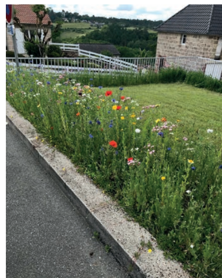
La gestion différenciée

C'est en prenant connaissance de ce qui est présenté en amont que vous trouverez les principales explications de ce petit changement d'habitudes.