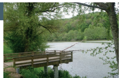
Sortie à l'étang de pêche à Le Lonzac

Pour me contacter : Sylvie Okupny 0656744177 ou par courriel : sylvie.okupny@laposte.net