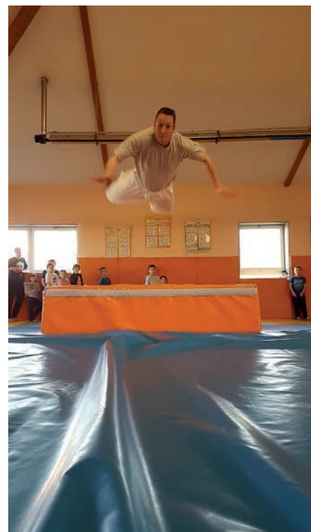
Le Prof de Judo