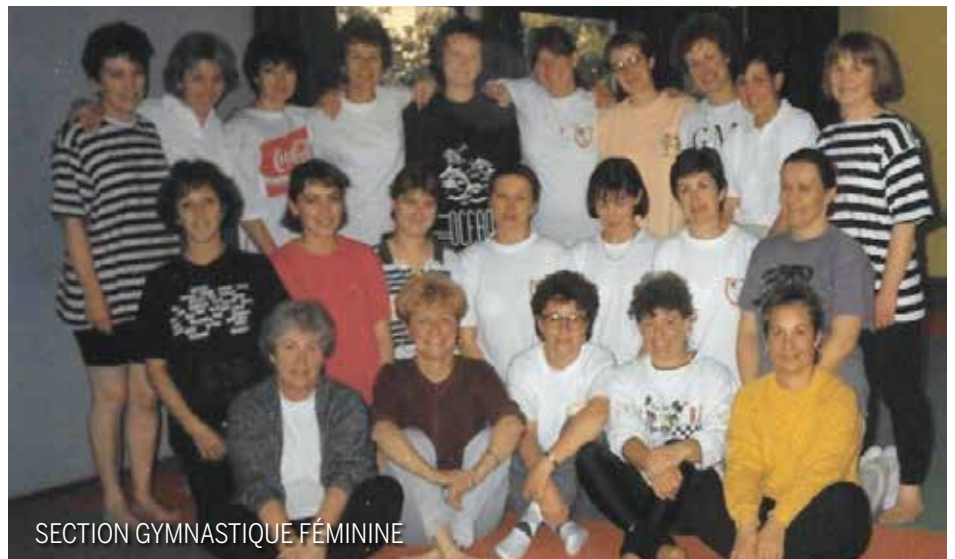
SECTION GYMNASTIQUE FÉMININE