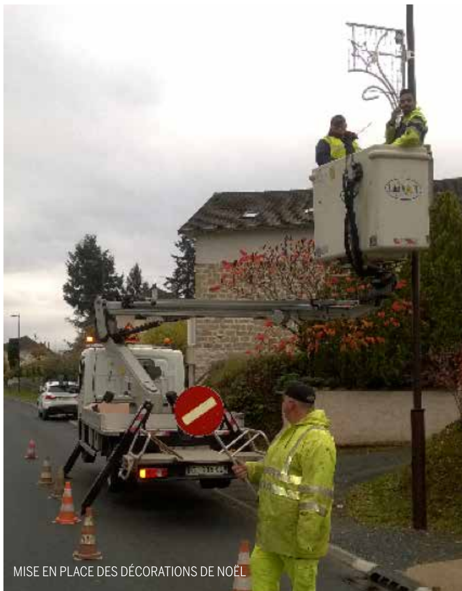
MISE EN PLACE DES DÉCORATIONS DE NOËL

Adjoint chargé des infrastructures, voirie et réseaux