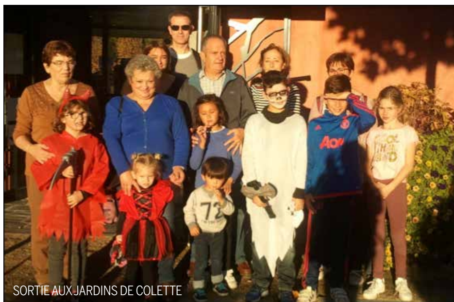
SORTIE AUX JARDINS DE COLETTE

Les sorties sont ouvertes à tous les Cosnacois (adultes avec ou sans enfants, seniors...) sur inscription.