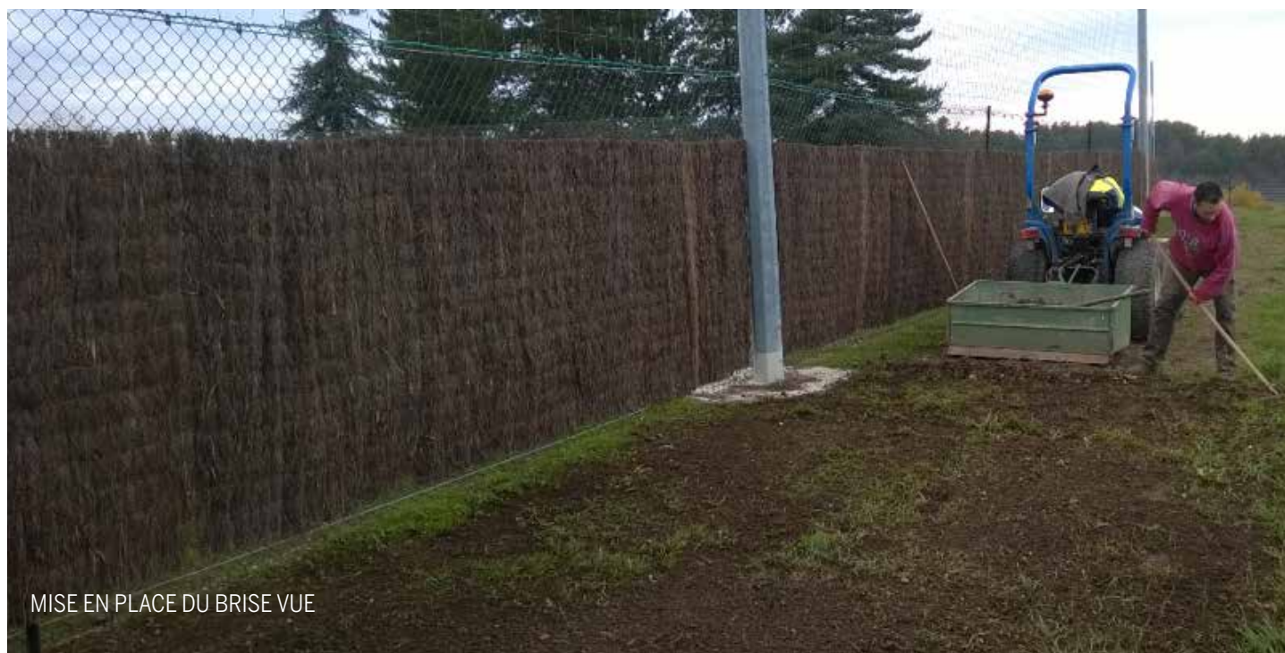
MISE EN PLACE DU BRISE VUE

Adjoint chargé des infrastructures, voirie et réseaux