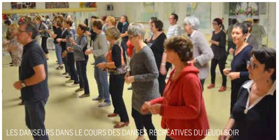
LES DANSEURS DANS LE COURS DES DANSES RÉCRÉATIVES DU JEUDI SOIR