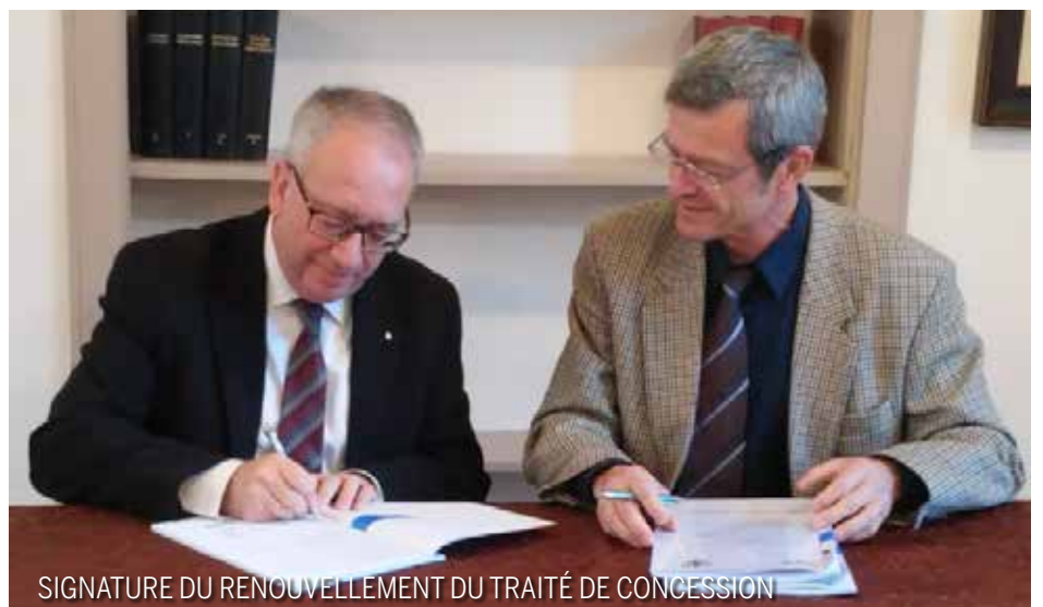
SIGNATURE DU RENOUVELLEMENT DU TRAITÉ DE CONCESSION

Actuellement, avec 15 kilomètres de réseau gaz naturel, GRDF dessert 265 foyers.