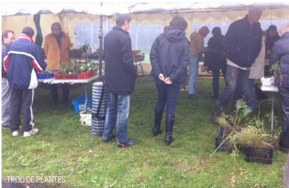
TROC DE PLANTES

Inauguré par la municipalité en avril 2013, le jardin partagé de Cosnac se compose de 32 parcelles familiales, et de 10 parcelles pour l'accueil de loisirs ou par les animations collectives. Ce jardin est un potager de proximité, géré par le centre municipal Adrien TEYSSANDIER, où bénévoles et particuliers se retrouvent