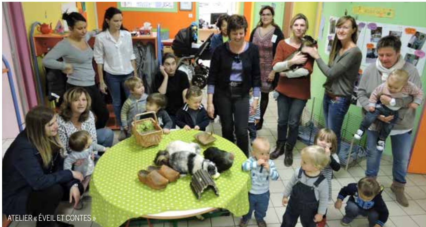
ATELIER « ÉVEIL ET CONTES »

Au mois de novembre, la ferme itinérante « ani'nomade » a fait une halte à l'atelier « éveil et contes » du lundi matin.