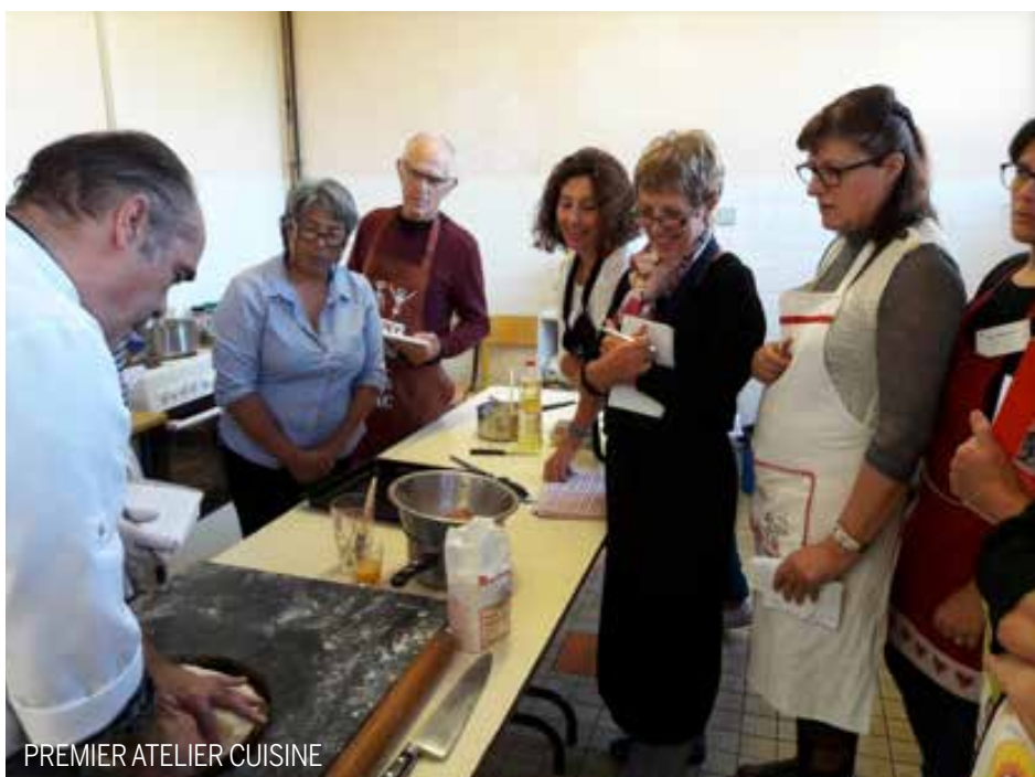
PREMIER ATELIER CUISINE

Le prochain atelier aura lieu le 28 janvier 2017 sur le thème des crêpes (bretonnes, suzette, salées, sucrées...). Pensez à vous inscrire.