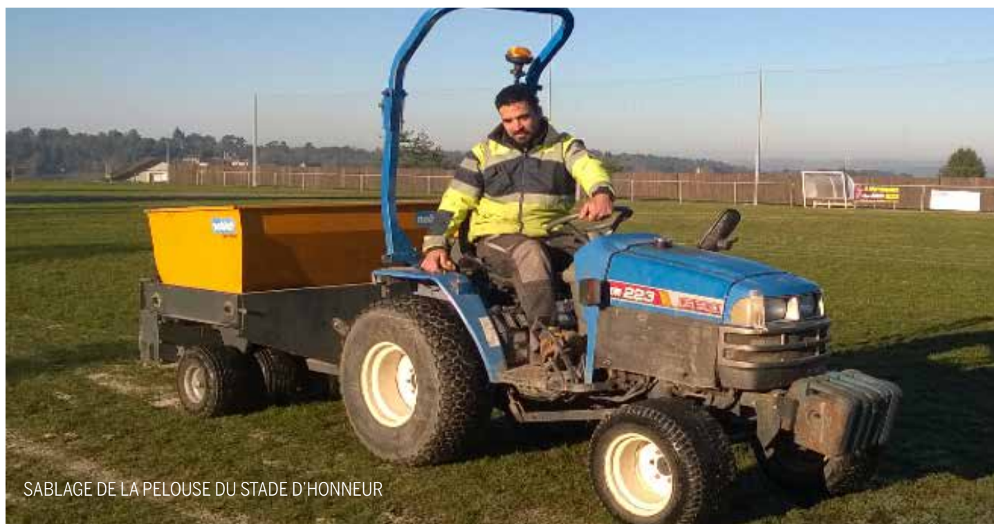
SABLAGE DE LA PELOUSE DU STADE D'HONNEUR